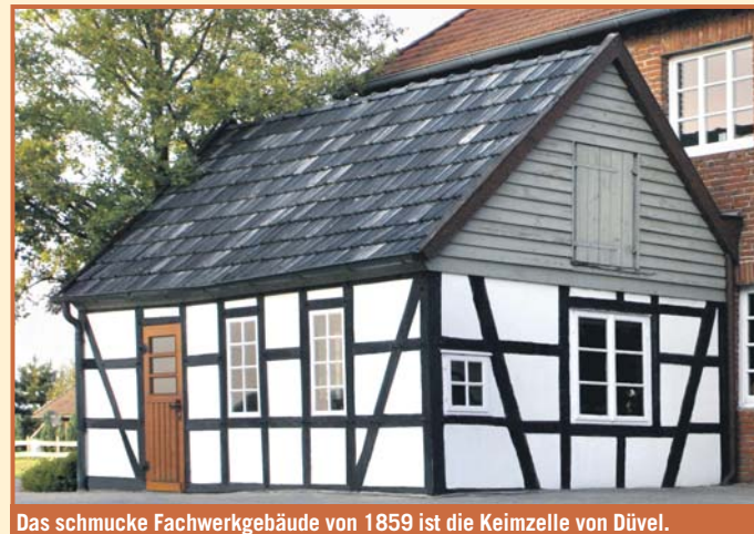
Das schicke Fachwerkgebäude von 1859 ist die Keimzelle von Düvel.

Dank an alle Kunden, Lieferanten und Freunde des Hauses. Wir freuen uns auf die Zukunft.