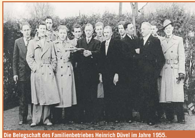
Die Belegschaft des Familienbetriebes Heinrich Düvel im Jahre 1955.